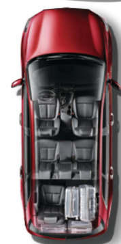
第三排右侧座椅折叠