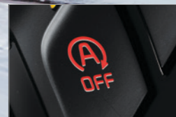
ISG发动机智能启停系统