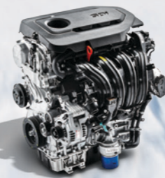
2.4 GDI Theta II 2.4 GDI Engine 最大功率 188 Ps/6,700 rpm 最大扭矩 241 N·m/4,000 rpm