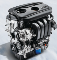
Nu 2.0 GDI Engine 最大功率 163 Ps/6,800 rpm 最大扭矩 203 N·m/4,700 rpm