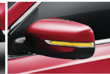
鸥翼式电动折叠后视镜集成转向灯