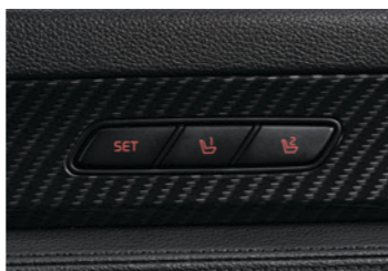
主驾驶席座椅记忆功能(外后视镜联动)