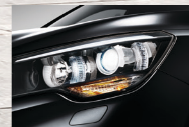
HID氙气大灯+LED日间行车灯

KX7傲雅的姿态展现了您凌然、轩昂的气度，前中网和大灯一体化的设计凸显了威风凛凛的气势，宽博的引擎盖，型锐造型的保险杠，见过KX7，大气硬朗将会成为您心目中的专用解释