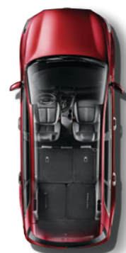
第二/三排座椅同时折叠