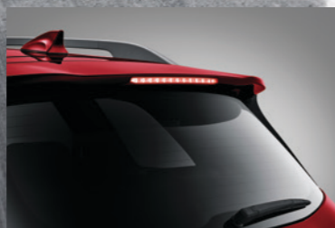
后扰流尾翼+LED高位制动灯