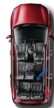
第二排右侧座椅向前移动并折叠