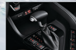
6挡手自一体变速器