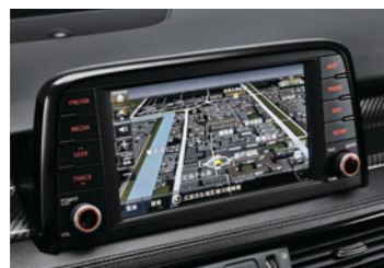
8英寸高清触摸屏+导航系统