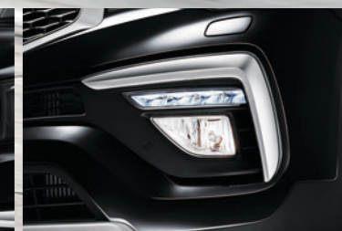
LED前雾灯+转弯辅助照明