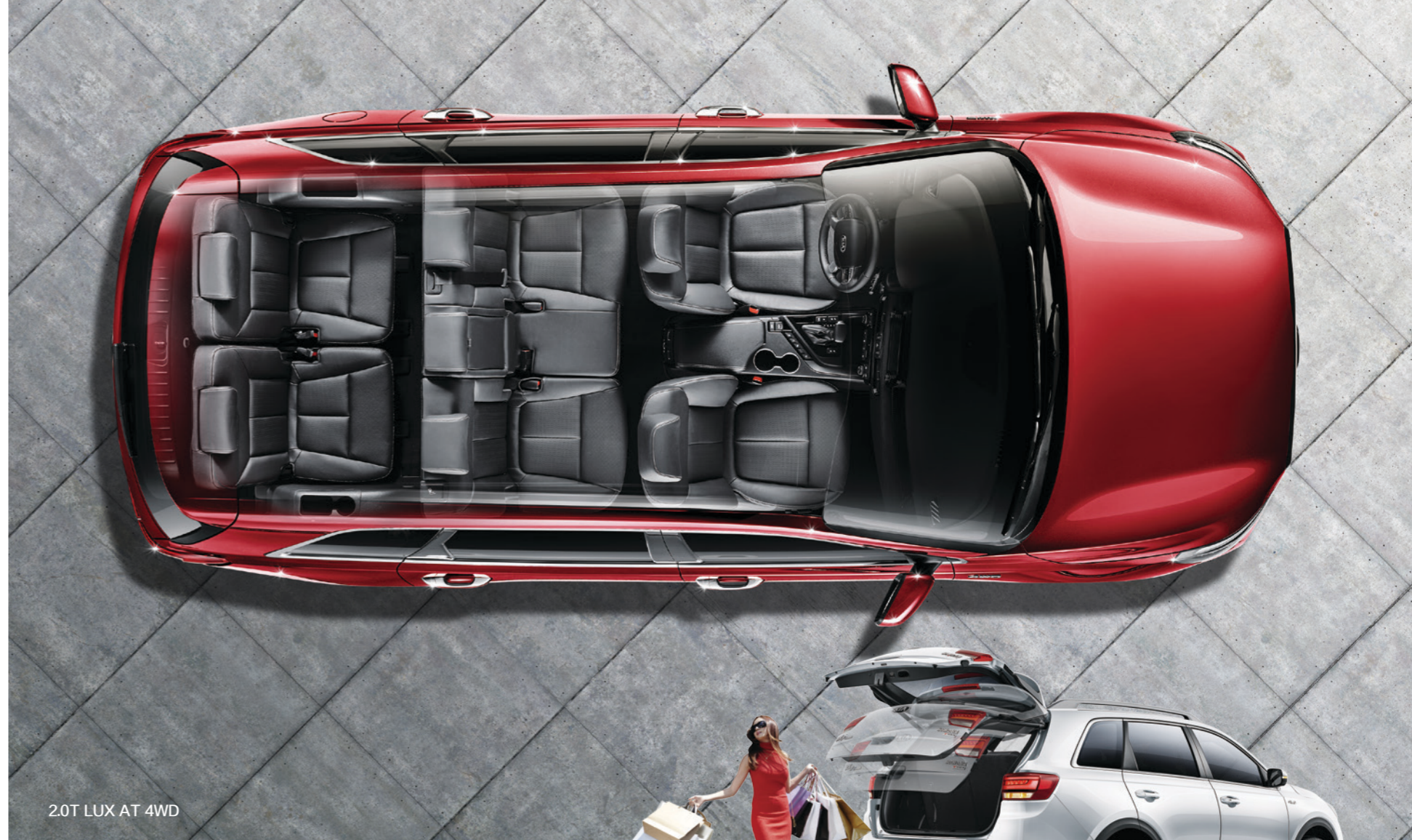
2.0T LUX AT 4WD