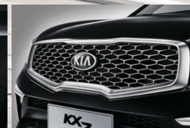
蜂窝状镀铬前中网