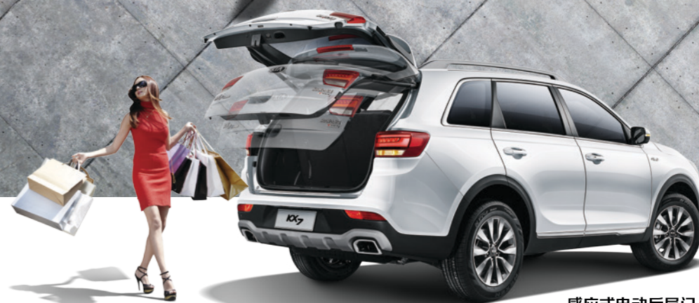
感应式电动后尾门

多样化的座椅布局方案，丰富的储物空间，轻松应对生活中一切需求旅行、露营、趣味活动等，不论乘坐还是载物都能超越期待