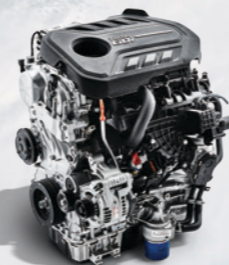
T GDI Theta II 2.0 T-GDI Engine 最大功率 241 Ps/6,700 rpm 最大扭矩 353 N·m/1,450~3,500 rpm

不论错综的城市道路，还是白雪皑皑的高原，驾驭原本就应自由；强劲的动力，卓越的燃油经济性，平常都市生活亦能纵怀驾驭。3款高性能发动机，实现您对动力的所有期待和奢享