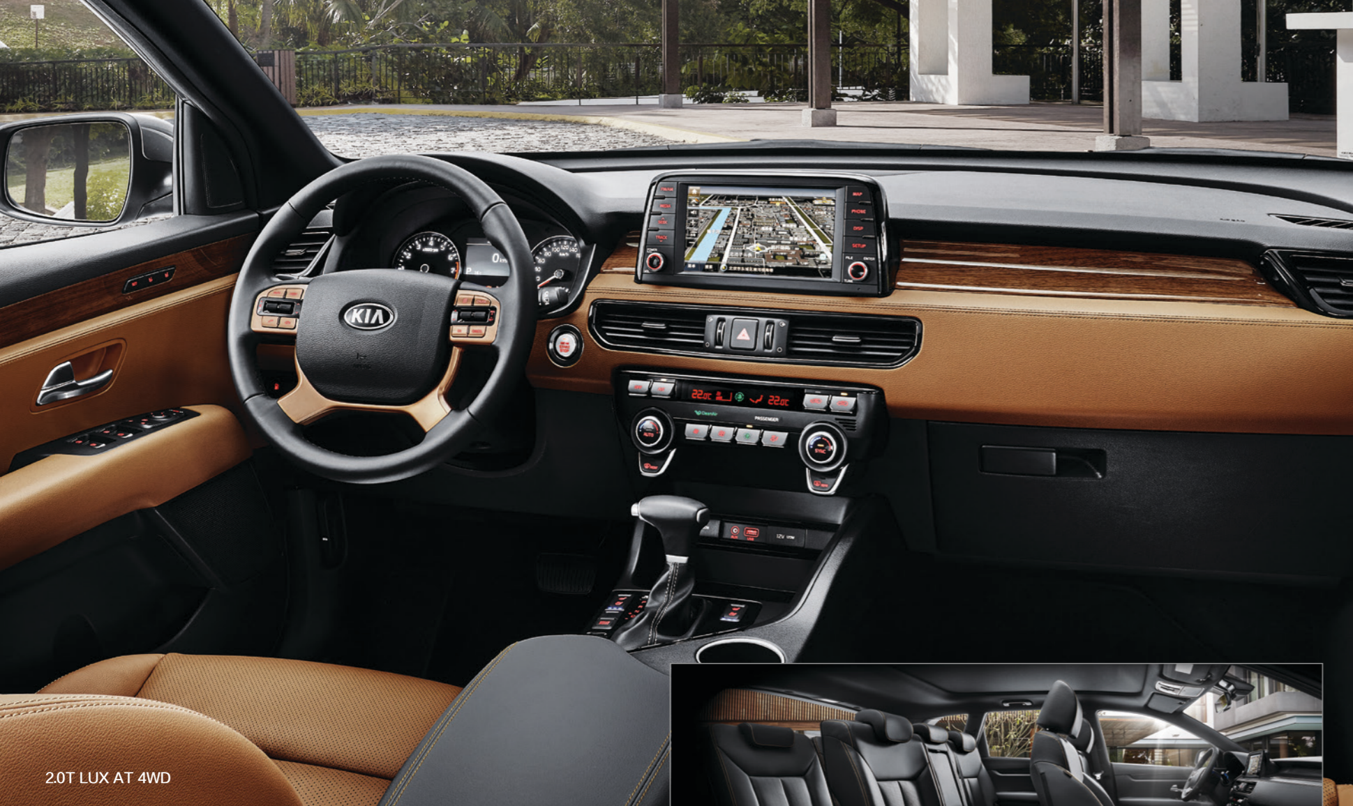
2.0T LUX AT 4WD