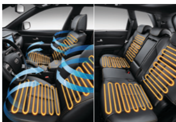
座椅加热 & 通风(第一排) 座椅加热(第二排)